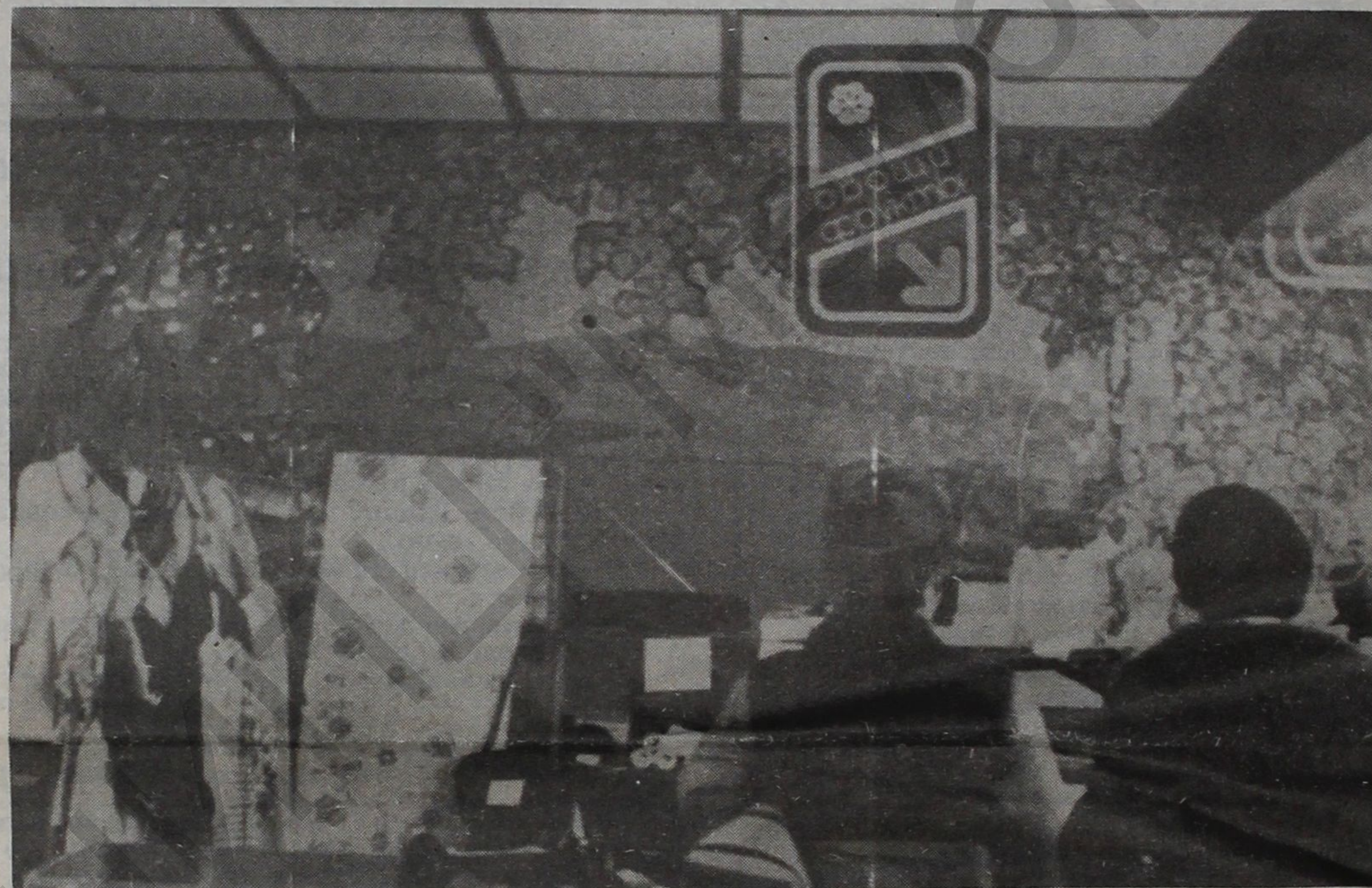
Вместо картошки - только обои, обувь, одежду и другие товары предлагают теперь коммерсанты в бывшем овощном отделе магазина № 30 по ул. Чертыгашева. К сожалению, такая неравноценная замена произошла и в других магазинах Абакана. Таковы первые результаты приватизации магазинов, доставляющие пока неудобства покупателям.

• Число крестьянских хозяйств на 1.7.92 г. в республике Хакасия составило 550, площадь - 6888, это в 4 раза больше, чем в начале 92-го года.