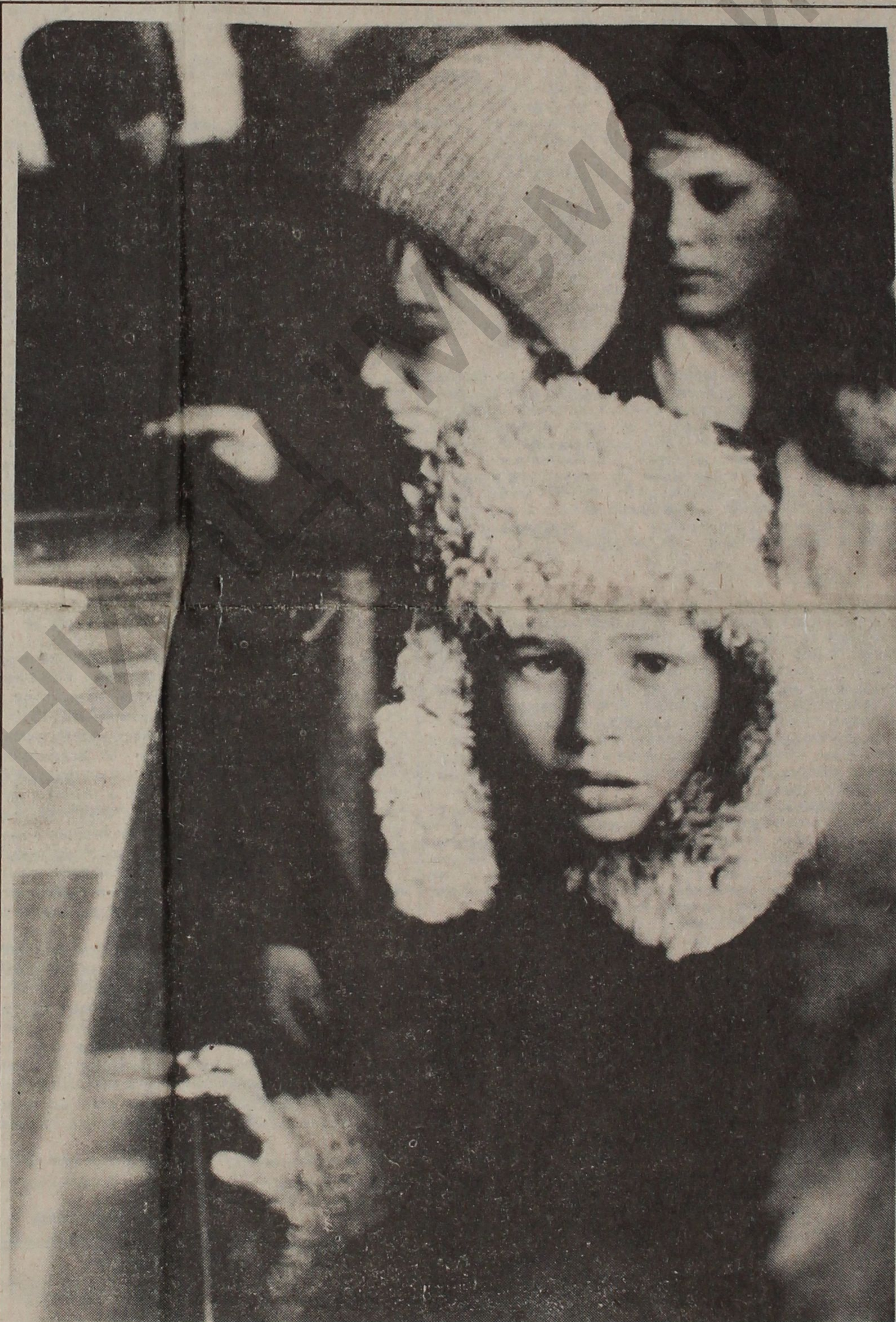
Когда же все будет на прилавке?

Помните об этом, господа - товарищи депутаты! Мы отдали свои голоса за вас, самых лучших, самых надежных. Мы ждем от вас не только пресловутого куска колбасы, не в этом дело! Но люди не простят вам, своим избранныкам, если первая, да! самая трудная для вас сессия закончится под "бурные и продолжительные", так ничего и не изменив в нашей жизни. Пожалуйста, помните об этом!