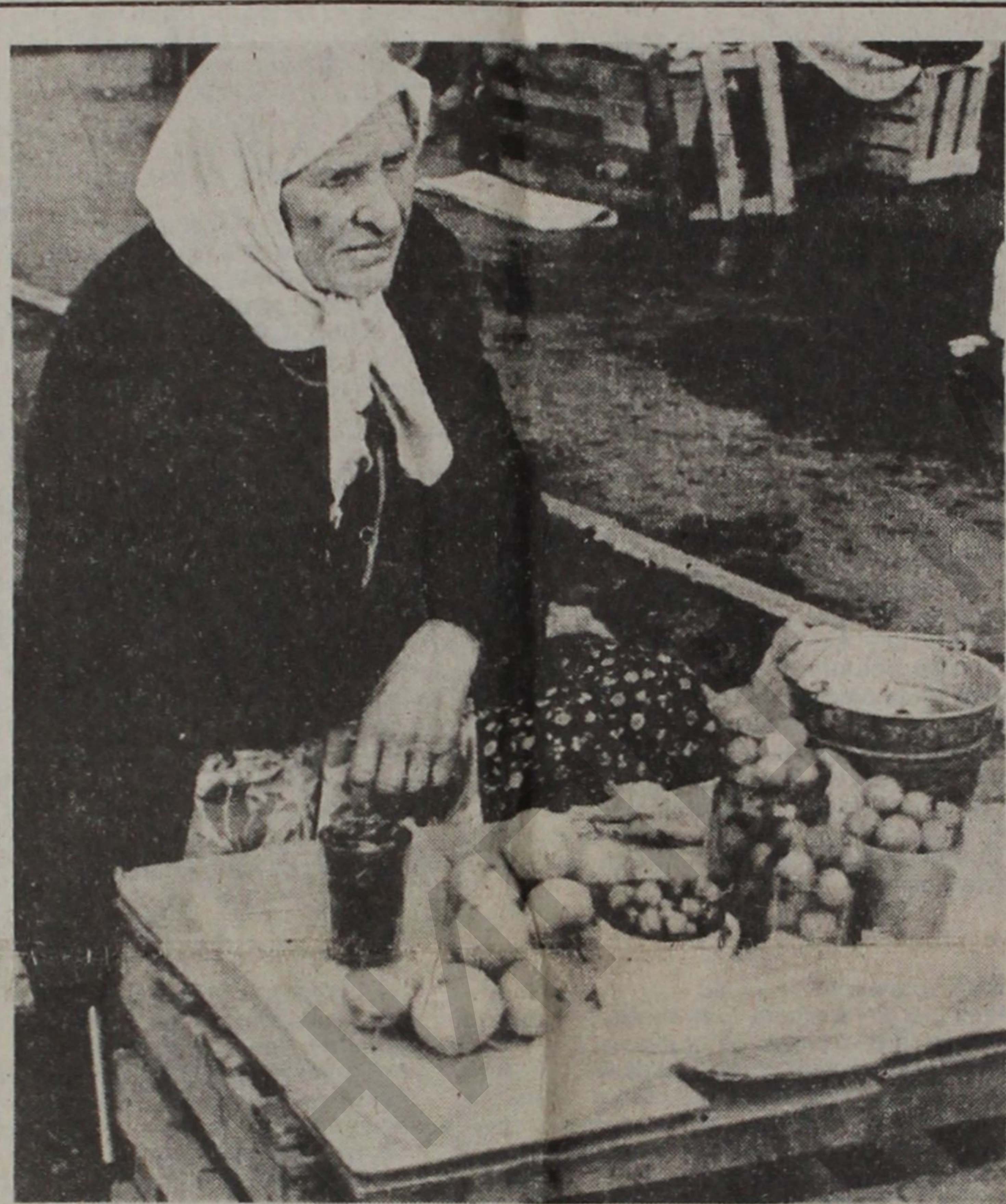
И пришли к рынку?