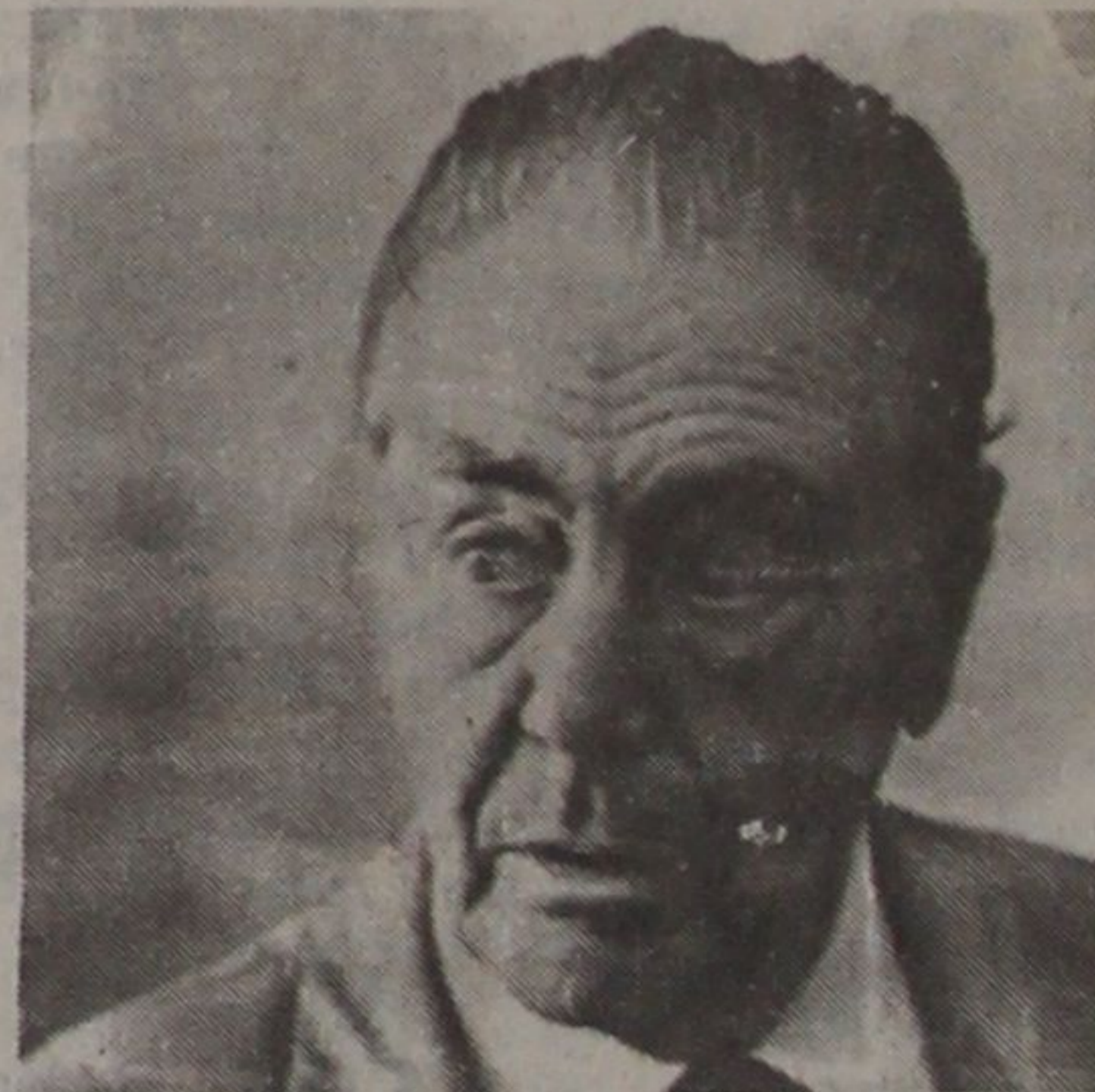
Барон Эдуард фон Фальц-Фейн: