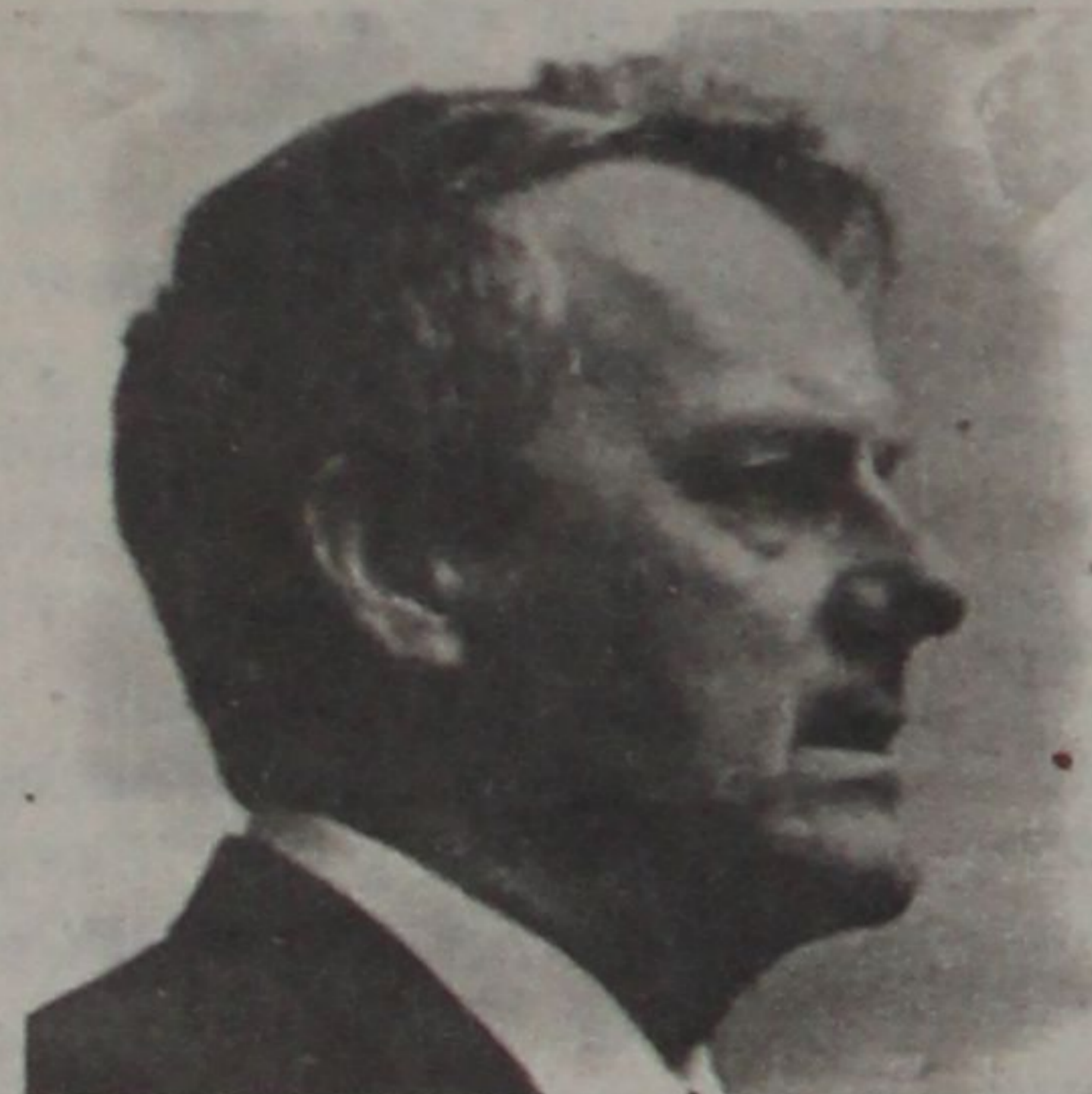
Мэр Санкт-Петербурга Анатолий Собчак.

Более благоприятствующего случая для этого исторического приглашения невозможно себе вообразить.