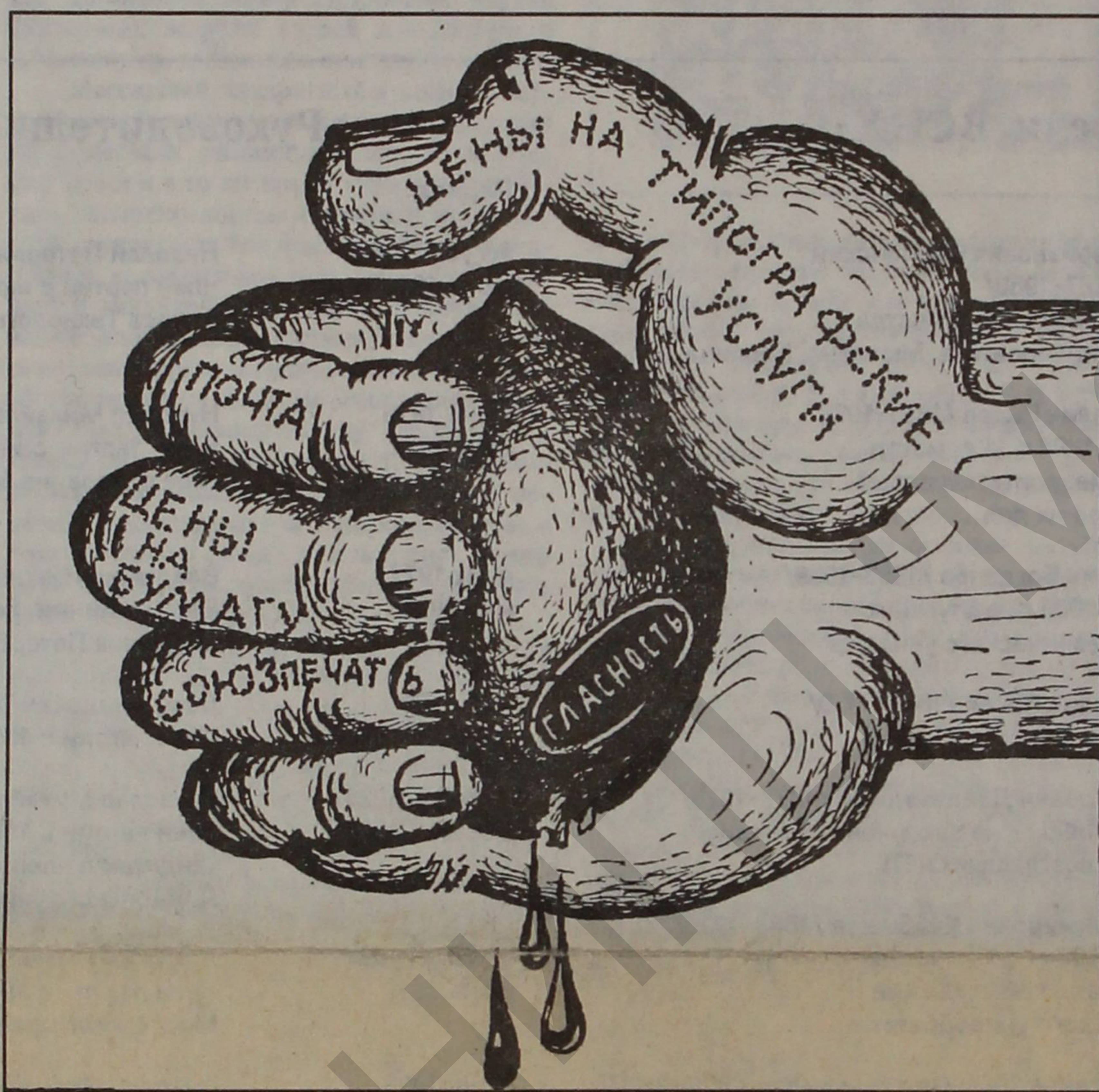
Рисунок Владимира Фирера

- У него револьвер! - крикнула девушка. - Обезоружьте его или он убьет нас обоих.