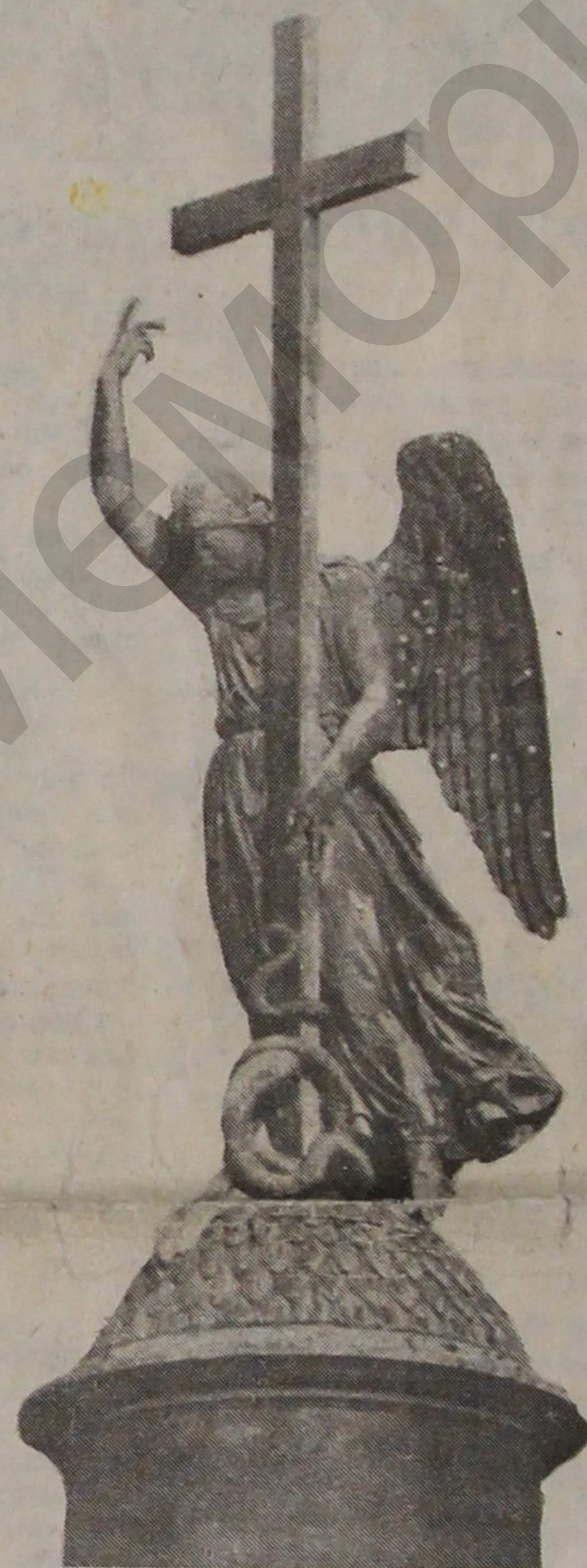
ПЕТЕРБУРГСКИЙ АПОКАЛИПСИС (Фрагмент)