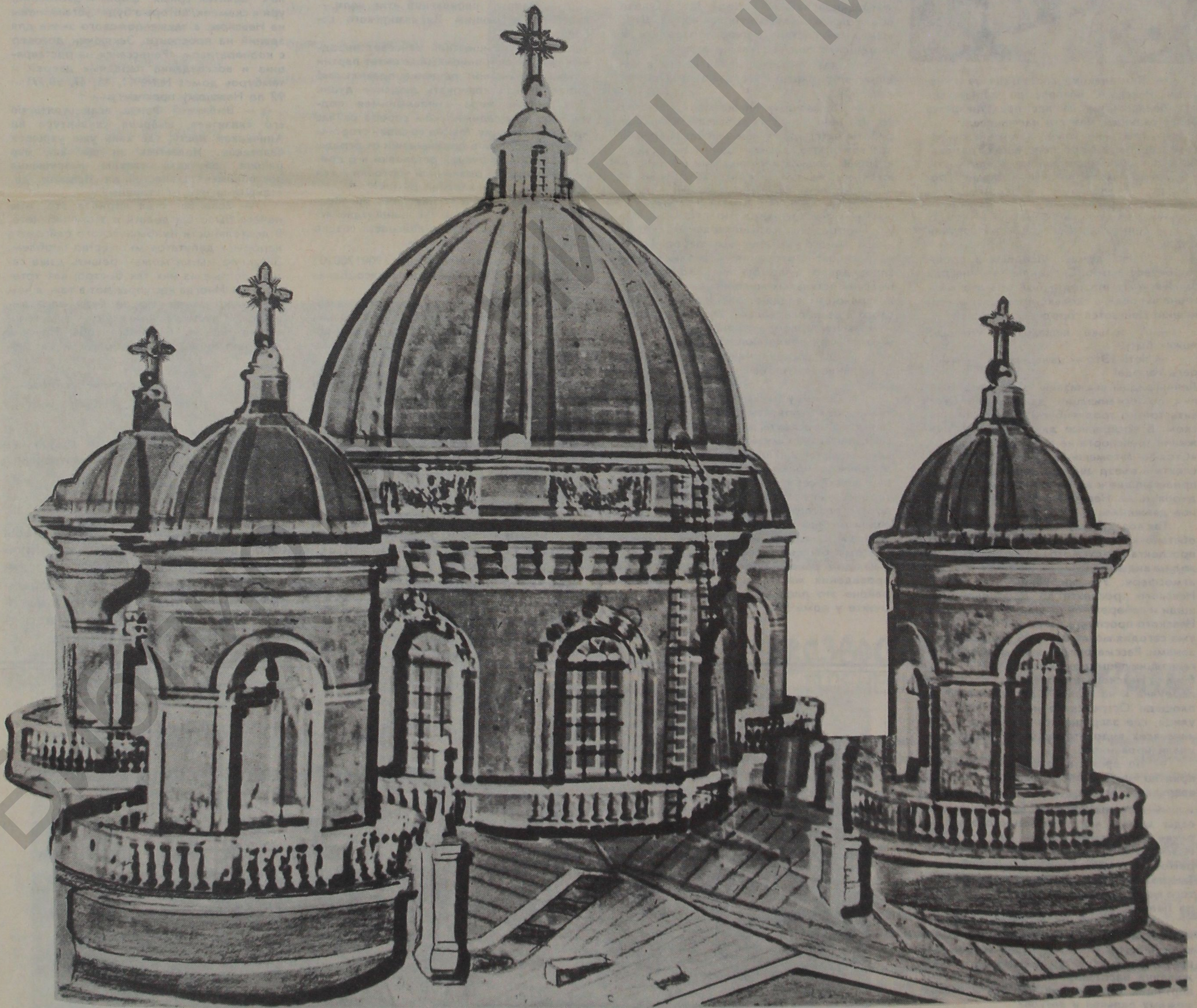
Купола Спасо-Преображенского собора