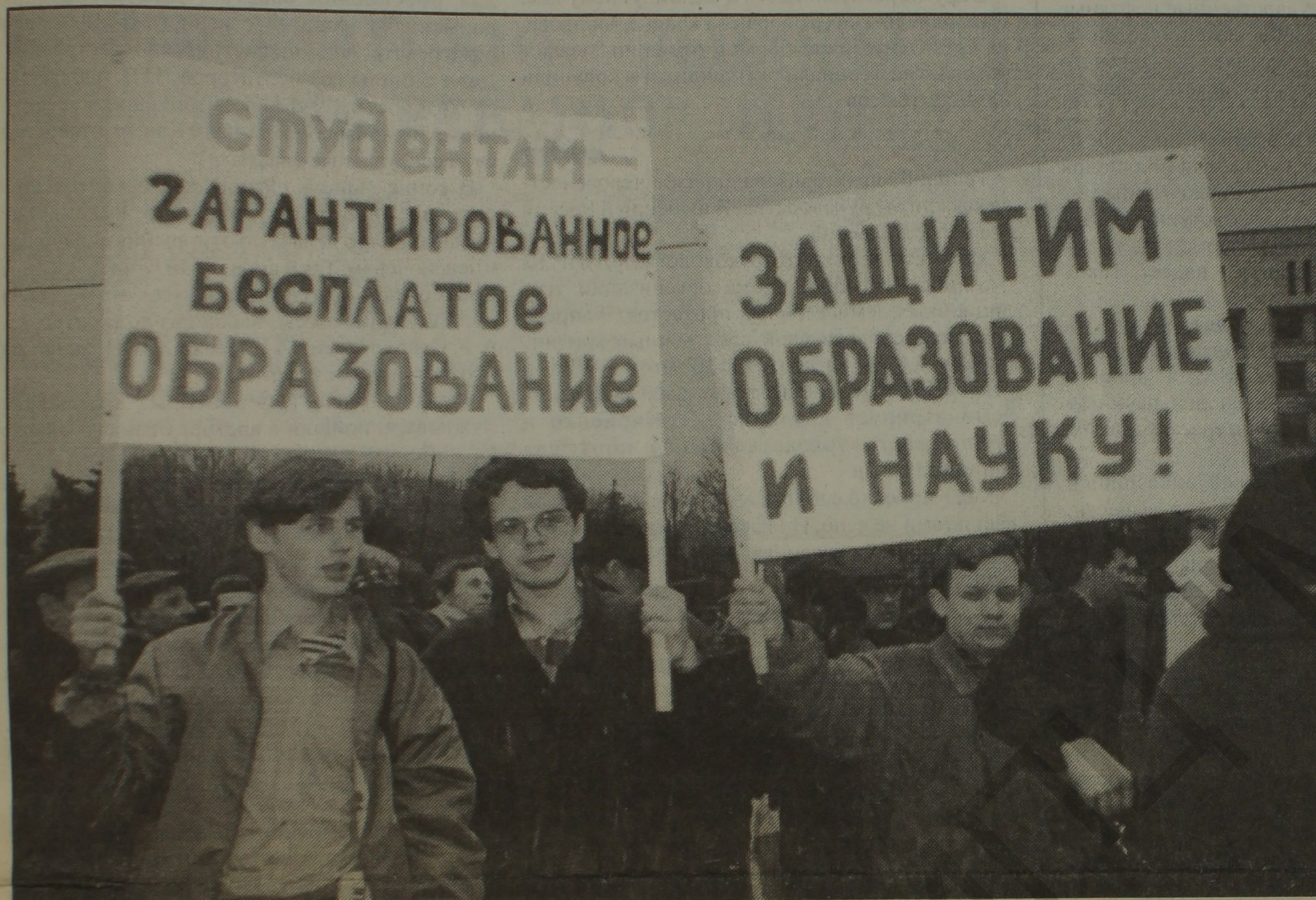
9 апреля 1998 года в день протеста официальных профсоюзов у Дома Правительства собрались студенты московских ВУЗов. Они протестовали против политики сокращения расходов на образование. Материалы о студенческом движении читайте на страницах 10, 11.

"РАБОЧАЯ ДЕМОКРАТИЯ" - ОРГАН КОМИТЕТА ЗА РАБОЧИЙ ИНТЕРНАЦИОНАЛ