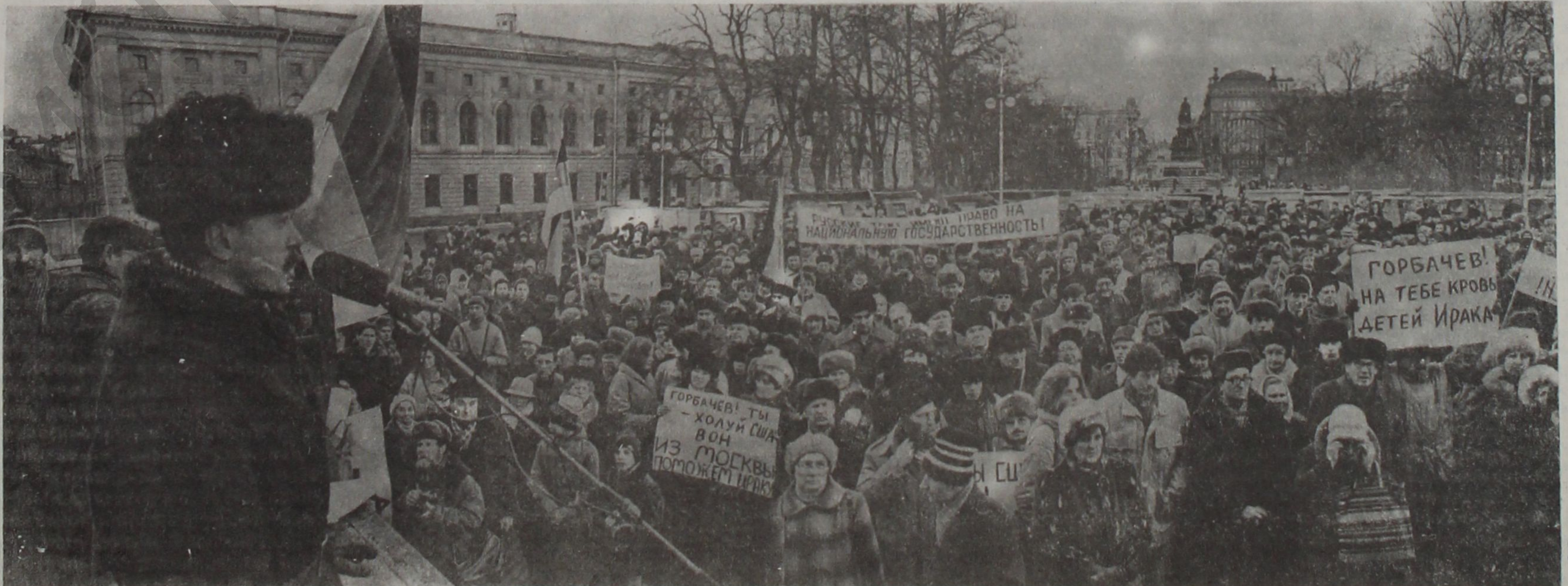
Митинг РНПР против американской агрессии в Ираке.

От имени партии народных республиканцев редакция газеты «Наше Время»