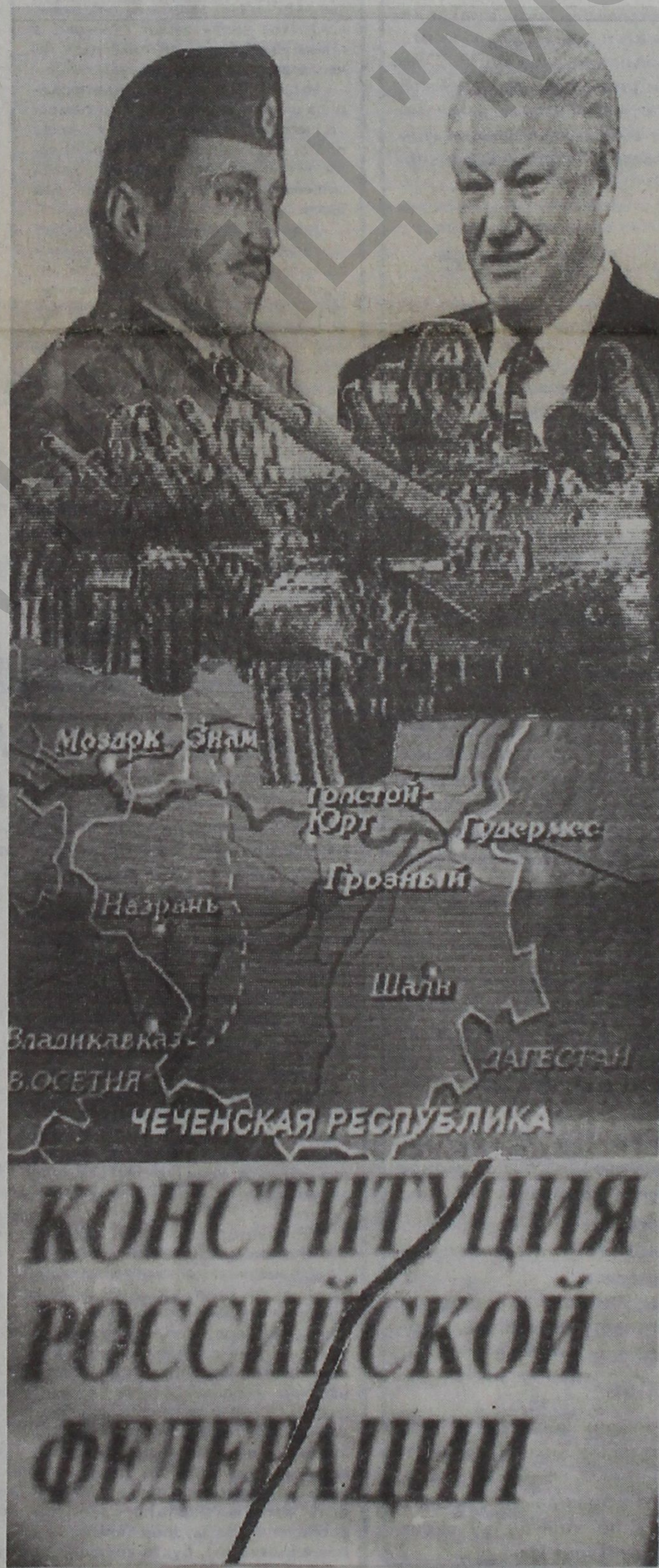
Коллаж Виталия ГЛАЗЫРИНА.