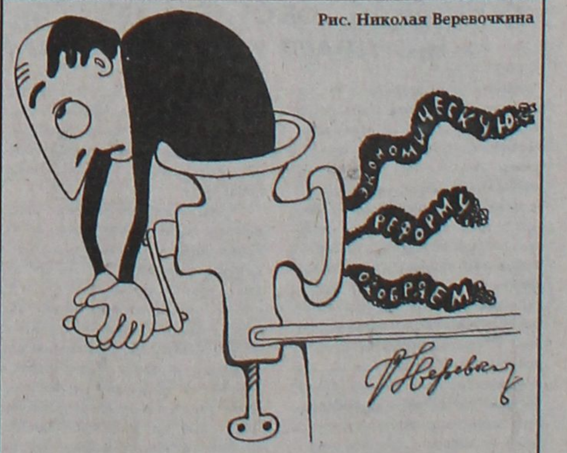
Рис. Николая Веревочкина