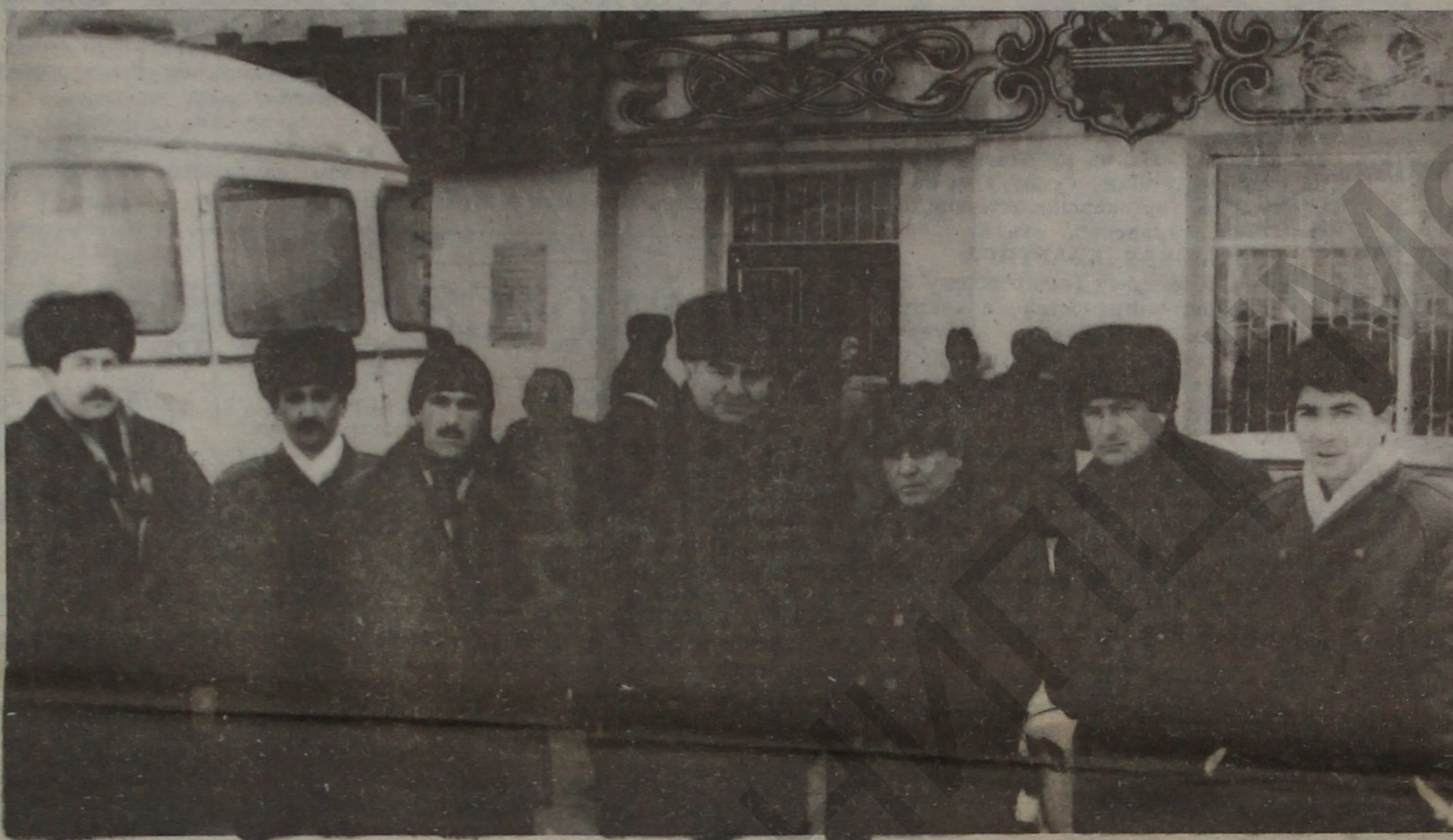
НА СНИМКЕ: на встрече с афганцами.