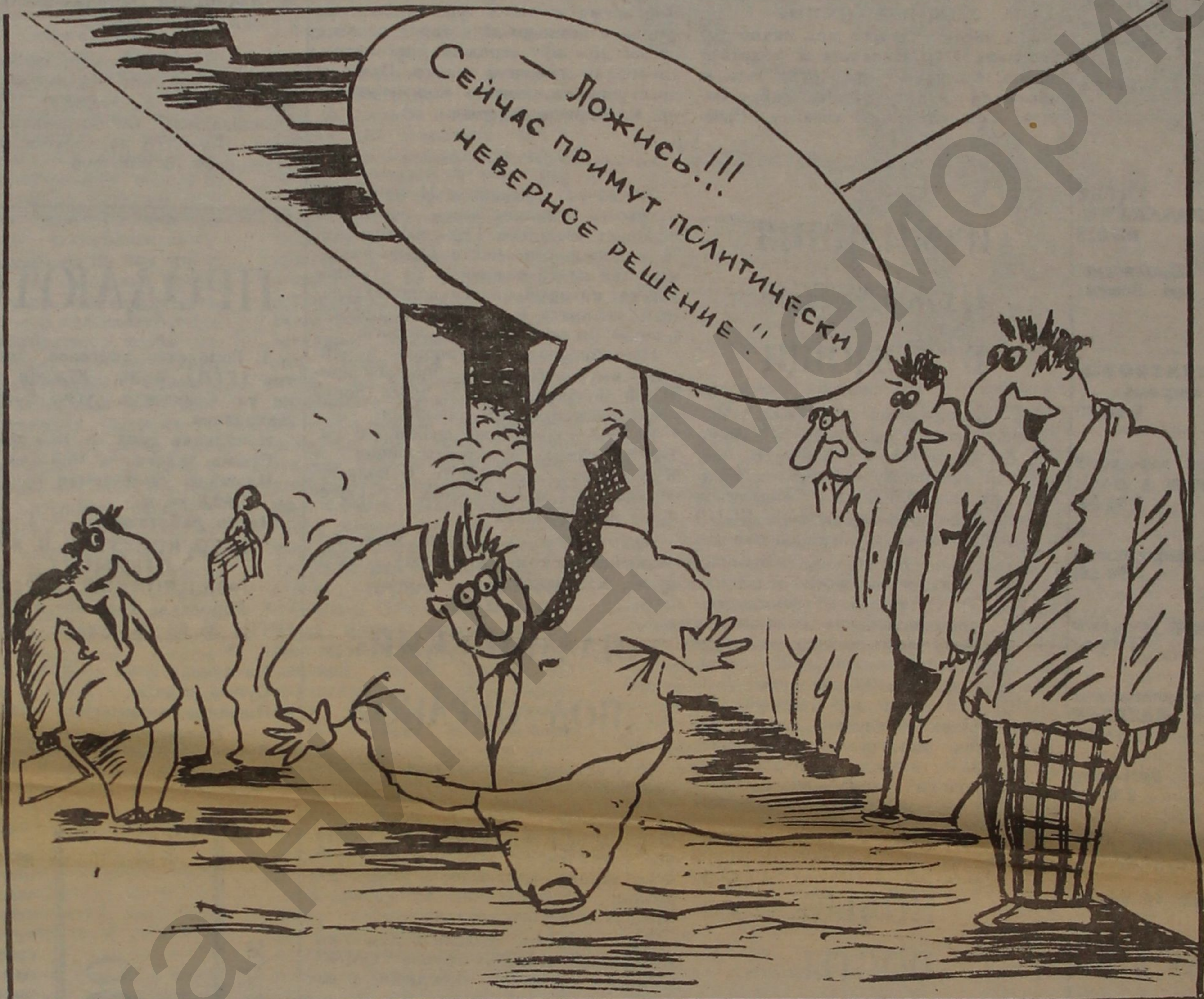
Рисунок В. ШИЛОВА.