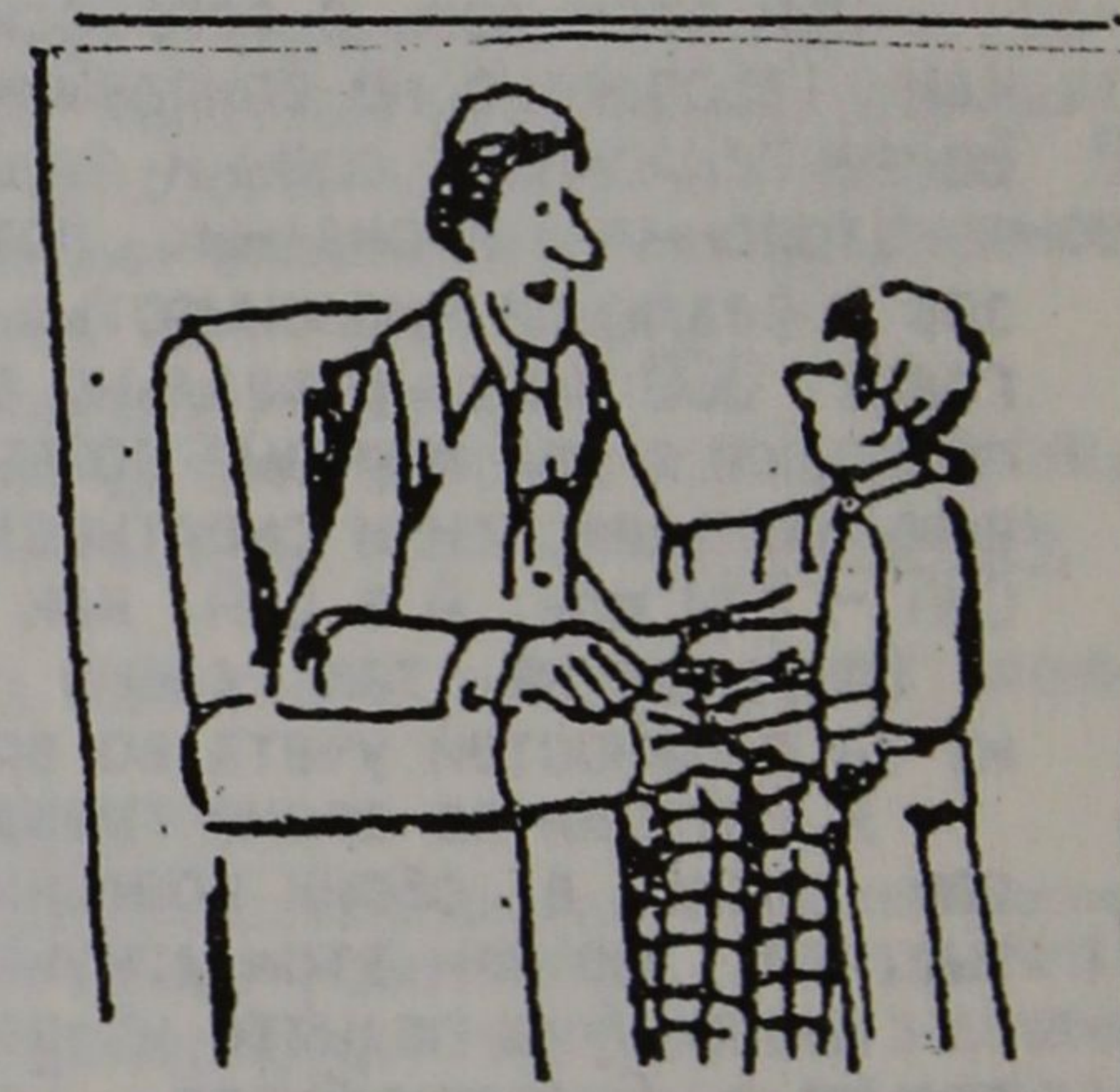
-Никогда не откладывай какое-либо дело на завтра - оно обойдется тебе вдвое дороже! "Канадиен трибюн", Торонто

К первому вопросу присоединилось еще несколько участников встречи. Второй вопрос вызвал разногласия присутствовавших. Большинство говорили, что такого не может быть, потому, что не может быть, но некоторые говорили: "У нас это тоже началось". В.Якуничкин