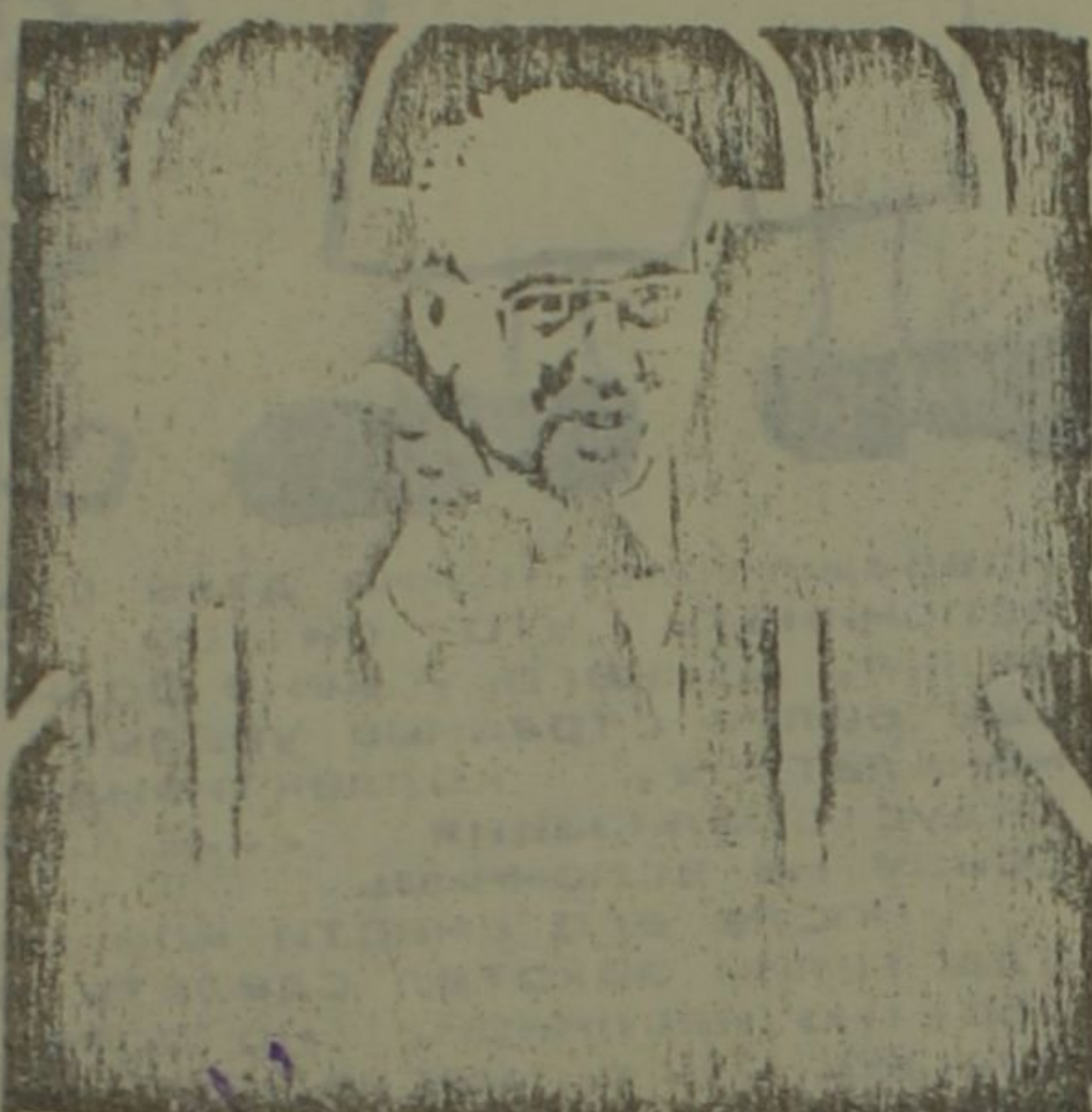
ных ошибок - значит он силен, а все задутые угрозы "справа" и "слева" только приумножат его силу. "Правые" ставят ему в вину

усадить в президентское кресло /бесцеремонно подставив под удар своего покорного судьбе конкурента/, а высший законодательный орган поручить старому приятелю - однокурснику/если он раз в месяц выдает новый, противоречащий прежнему, вариант истины и перед лицом самых вопиющих несоответствий не признает собствен-