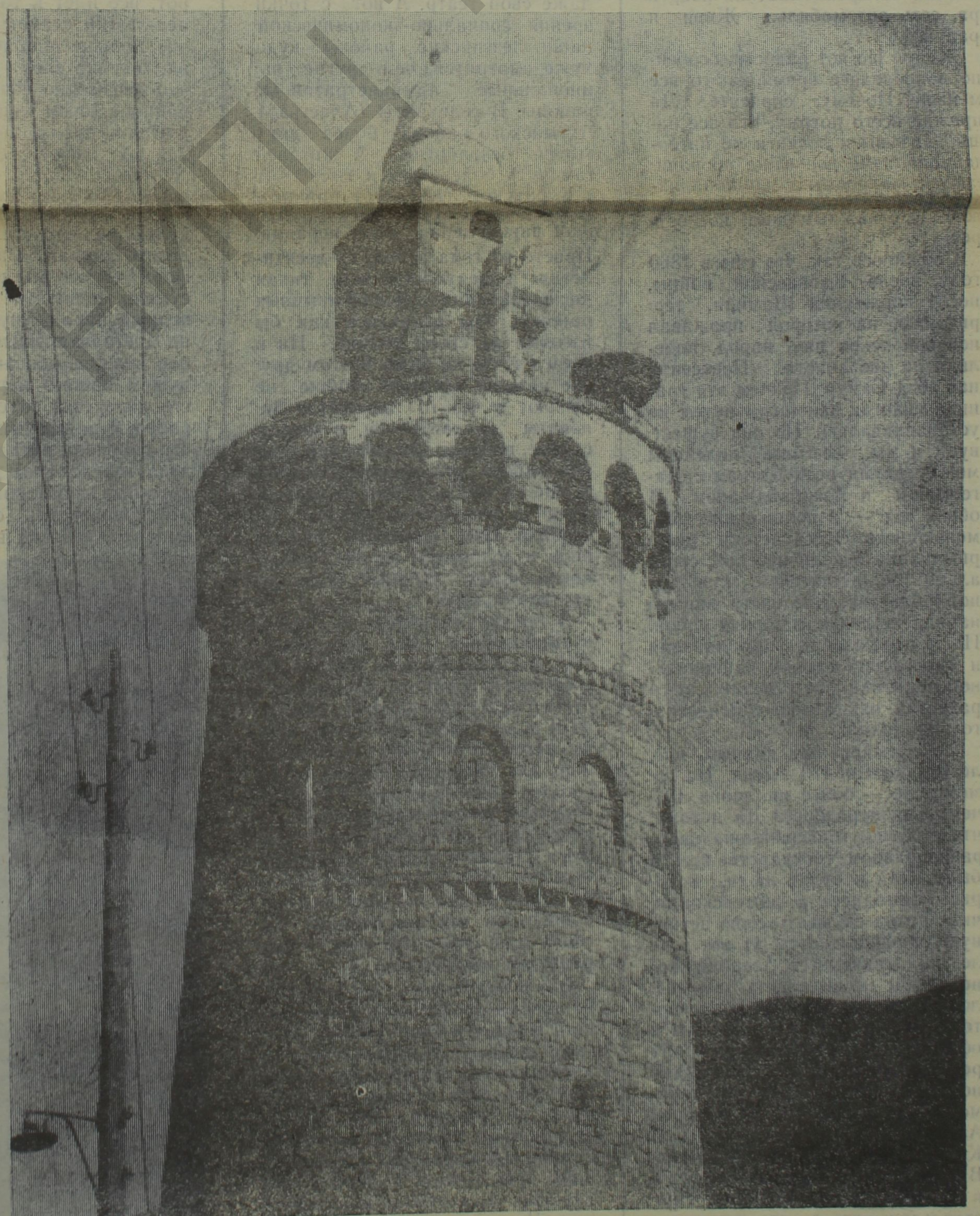
Тпигъ хуьруьн минарет. Агъул район. Шикил ягъайди Т. Мегьамедов я.