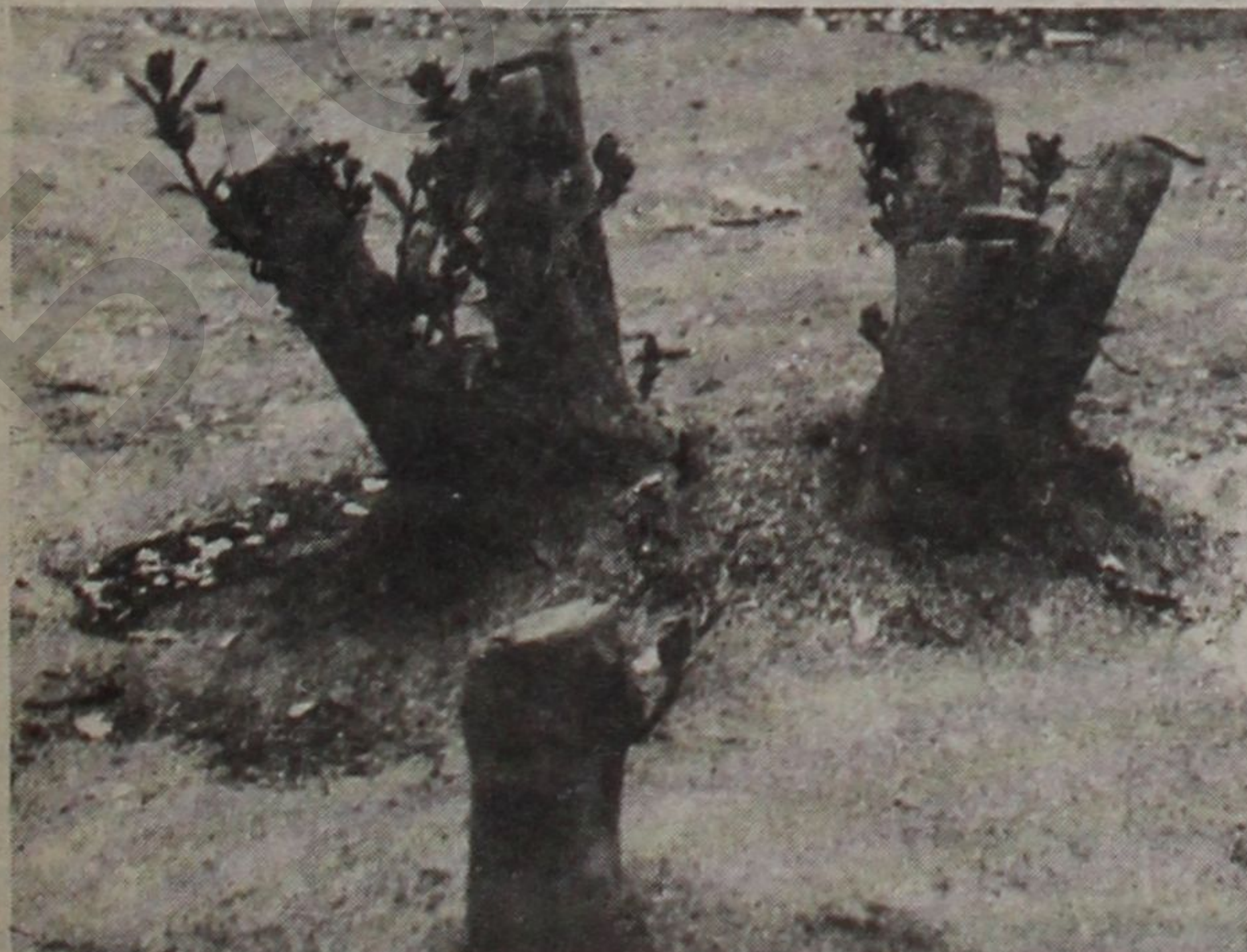
Торпағымыза, көкүмүзә сығынмышыг, нә гәдәр будансаг, көсилсәк дә јенә көјәриб көјләрә бојланаचाғыг, Түрк оғлу!

АМАЛЫМЫЗ—ӨНЧӘ ВӘТӘНДИР. АТА ЈУРДУНУН ОЧА-ҒЫ СӨНМӘСИН КӨРӘК, ДЕЈИРДИК. АММА АРХАСЫЗ, ИИ-ЈӘСИЗ ОЛДУГ. ЈАҒЫ ОЧАҒЫМЫЗЫ СӨНДҮРДҮ, ЈУРДУМУ-ЗУ ЈАҒМАЛАДЫ. ИНДИ КӨНӨЛӘН ИЧИМИЗДӘН, ДАҒЫ-ДЫЛМЫШ МӘЗАРЛАРЫМЫЗДАН, УЛВИ ШӘНИДЛӘРИМИЗ-ДӘН, ПАРАЛАНМЫШ ВӘТӘНИМИЗДӘН БИР МҮГӘДДӘС СӘС КӘЛИР: ӨНЧӘ—ВӘТӘНДИР! ВӘТӘНӘ ГАҒЫДЫШДЫР! БИЗ ГАҒЫДАЧАҒЫ!