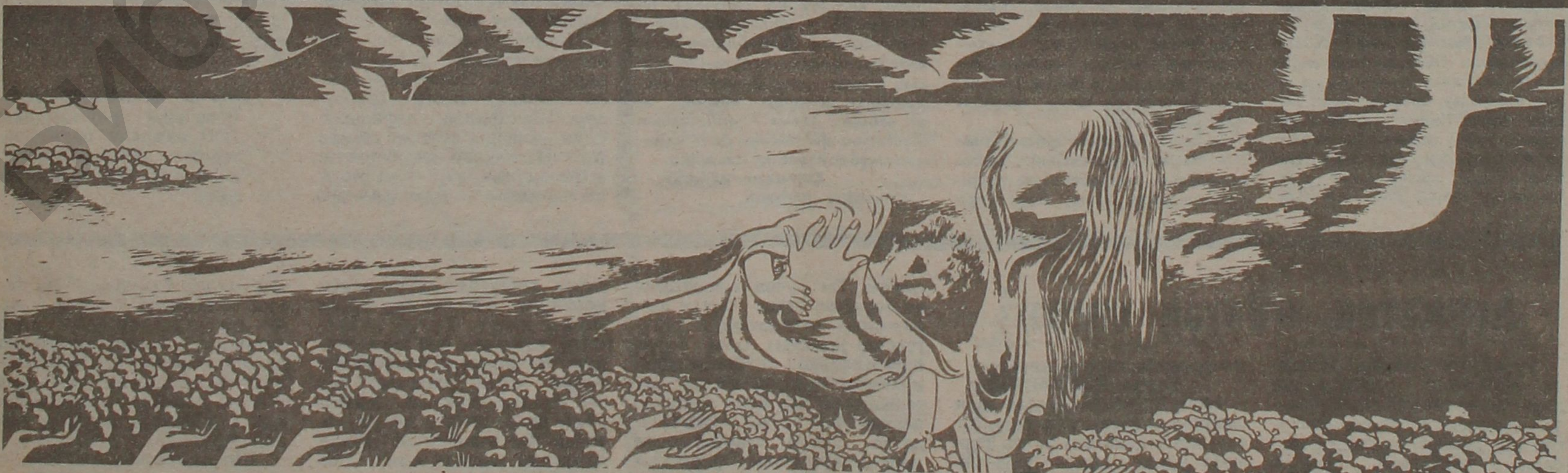
Рəссам Бəјүкағанын «Шəһидлəр» графикасында фəрагментлəр.