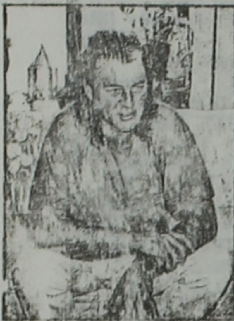
И. Гиллан: «Люблю мощную музыку»