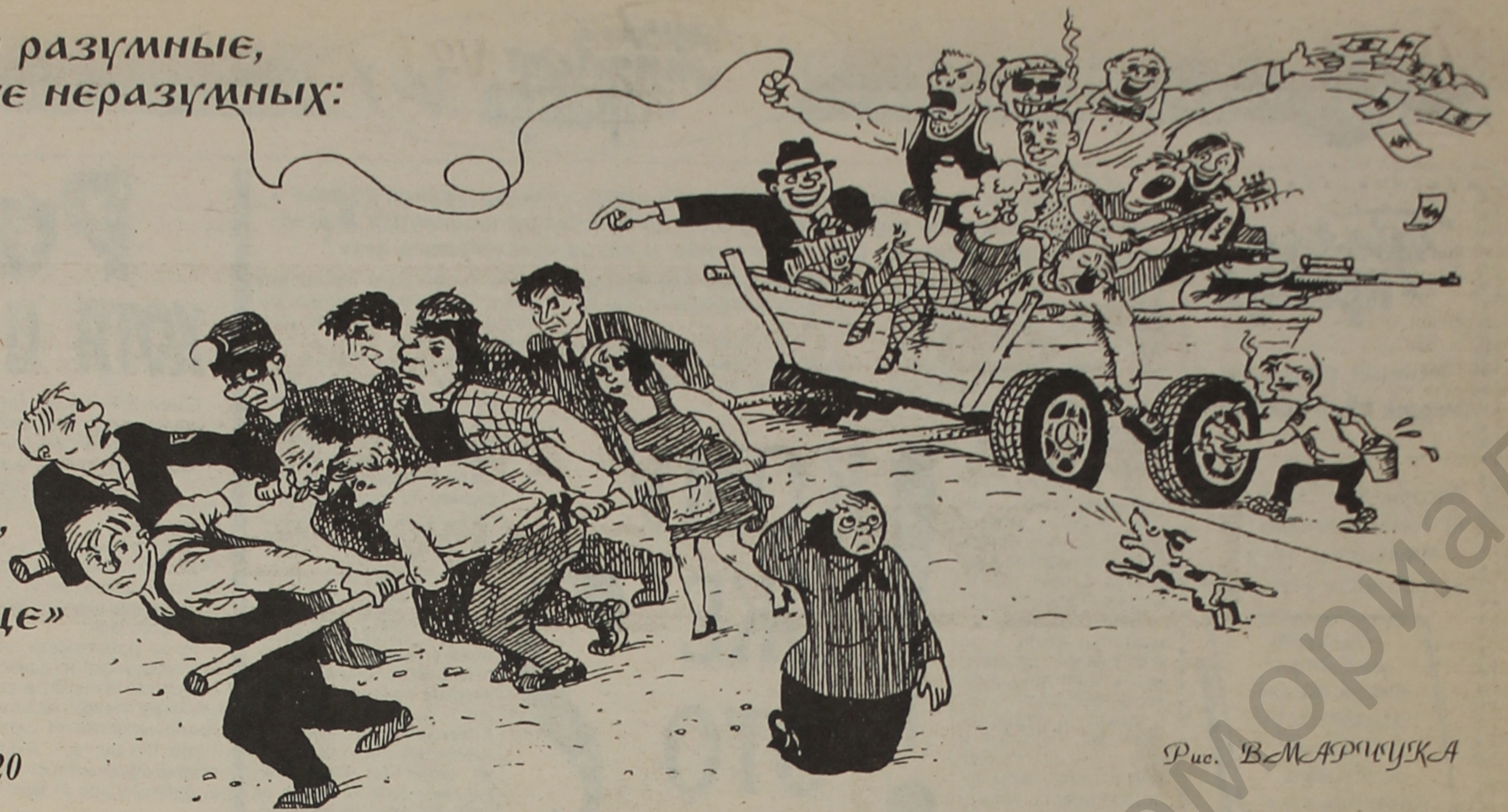
Рис. В. М. АРТУХА