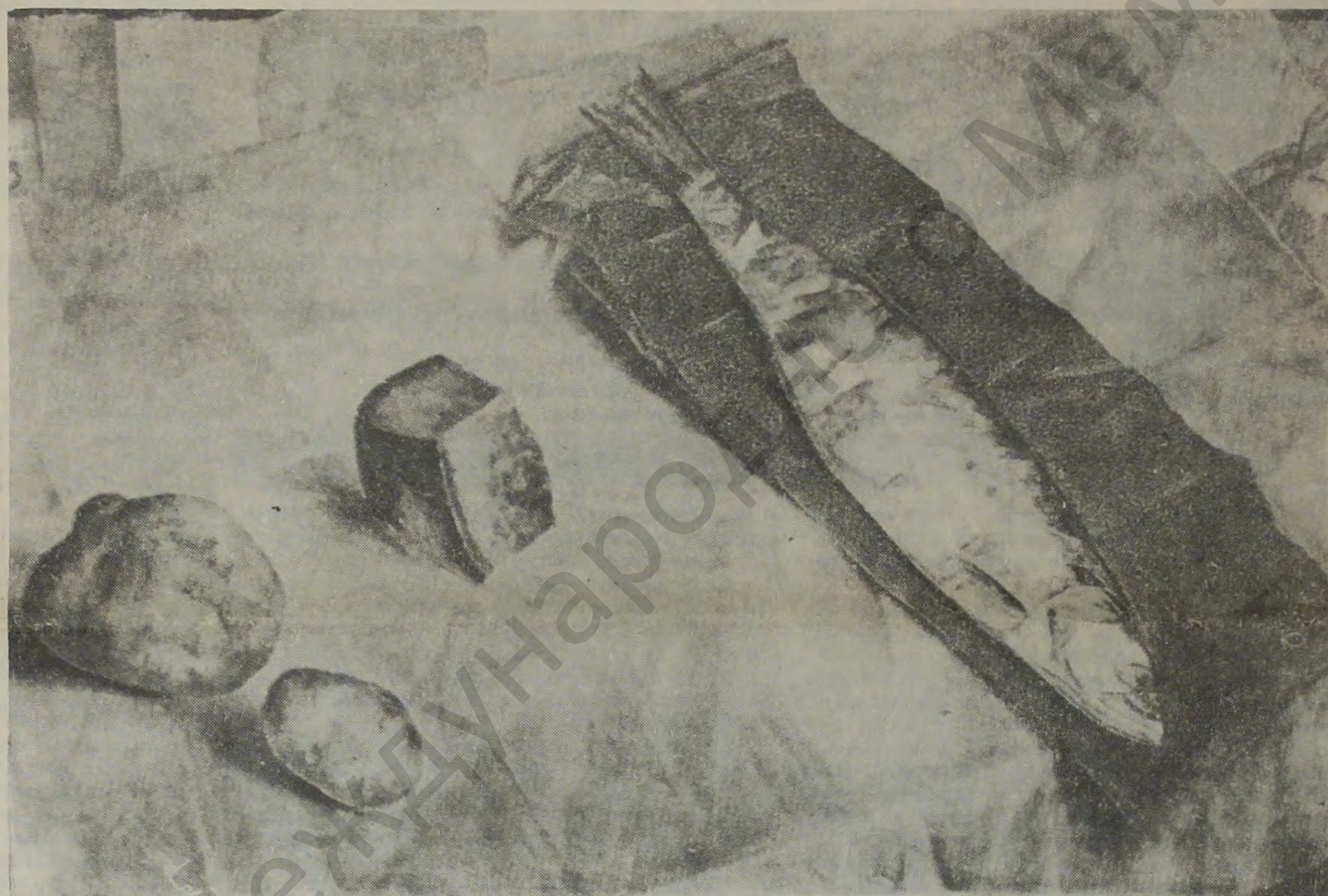
К. ПЕТРОВ-ВОДКИН. НОВОГОДНИЙ СТОЛ РЯДОВОГО УСТЬ-КАМЕНОГОРЦА. 1992 г. - У.М.

Одна тысяча девятьсот девяносто второй год подошел к концу. Это был високосный год. И истинные ученые, и всякие глобальные и кашпировские чумаки в один голос утверждают, что любой високосный год - это год всевозможных потрясений, катаклизмов, как в физической жизни планеты, так и в социальной и политической жизни народов, эту планету населяющих.