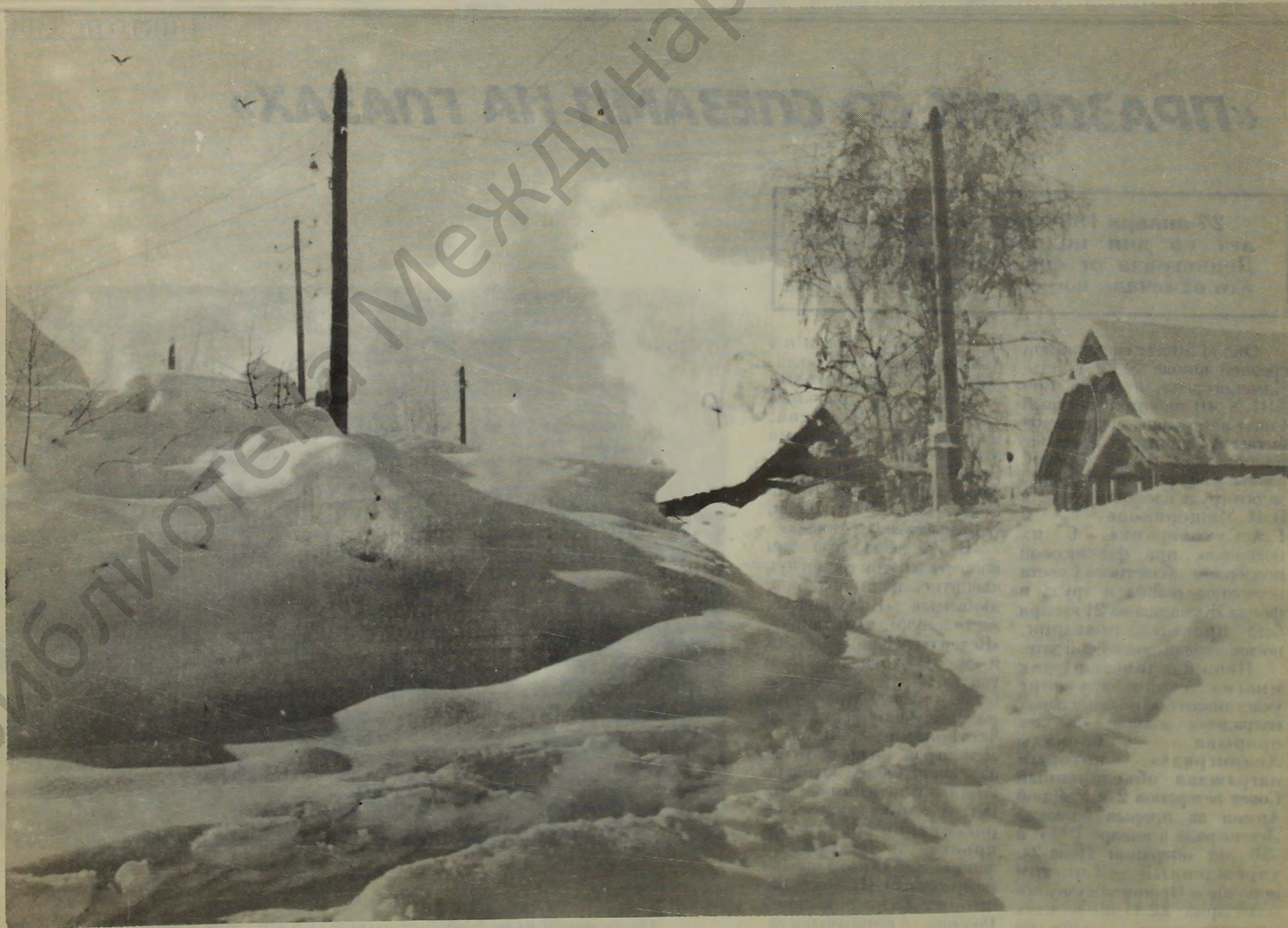
Зима Алтайская.

В.ЩЕТНИКОВА , руководитель пресс-службы городской администрации.