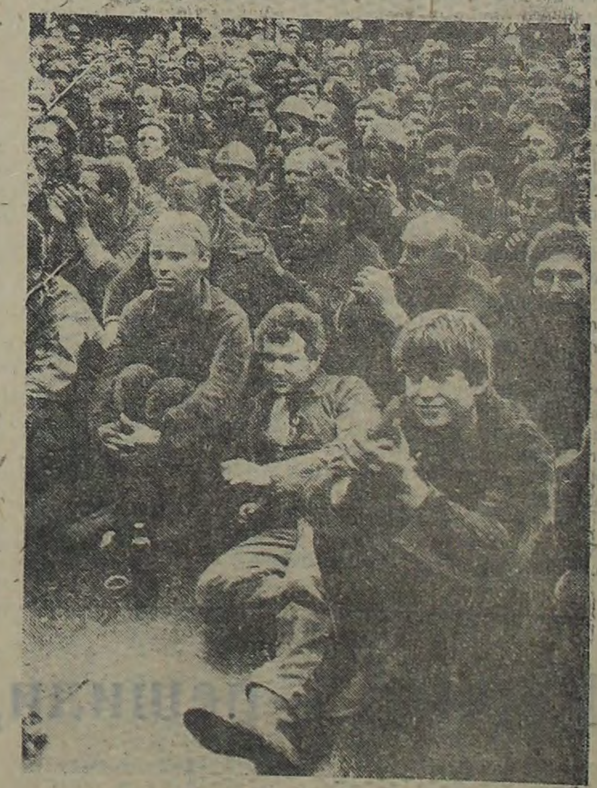
Забастовка, забастовка...

— У нас на «Коммунисте» тяжелое положение. Забастовка грозит нам остановкой шахты, кризисом, из которого нам не выкарабкается. Все осознают это, но отказываются от борьбы не собираются. Дело только за выбором методов... И так, позиция молодого шахтера — забастовка нужна лишь в самый критический момент. А кто определит, какой именно момент критический?