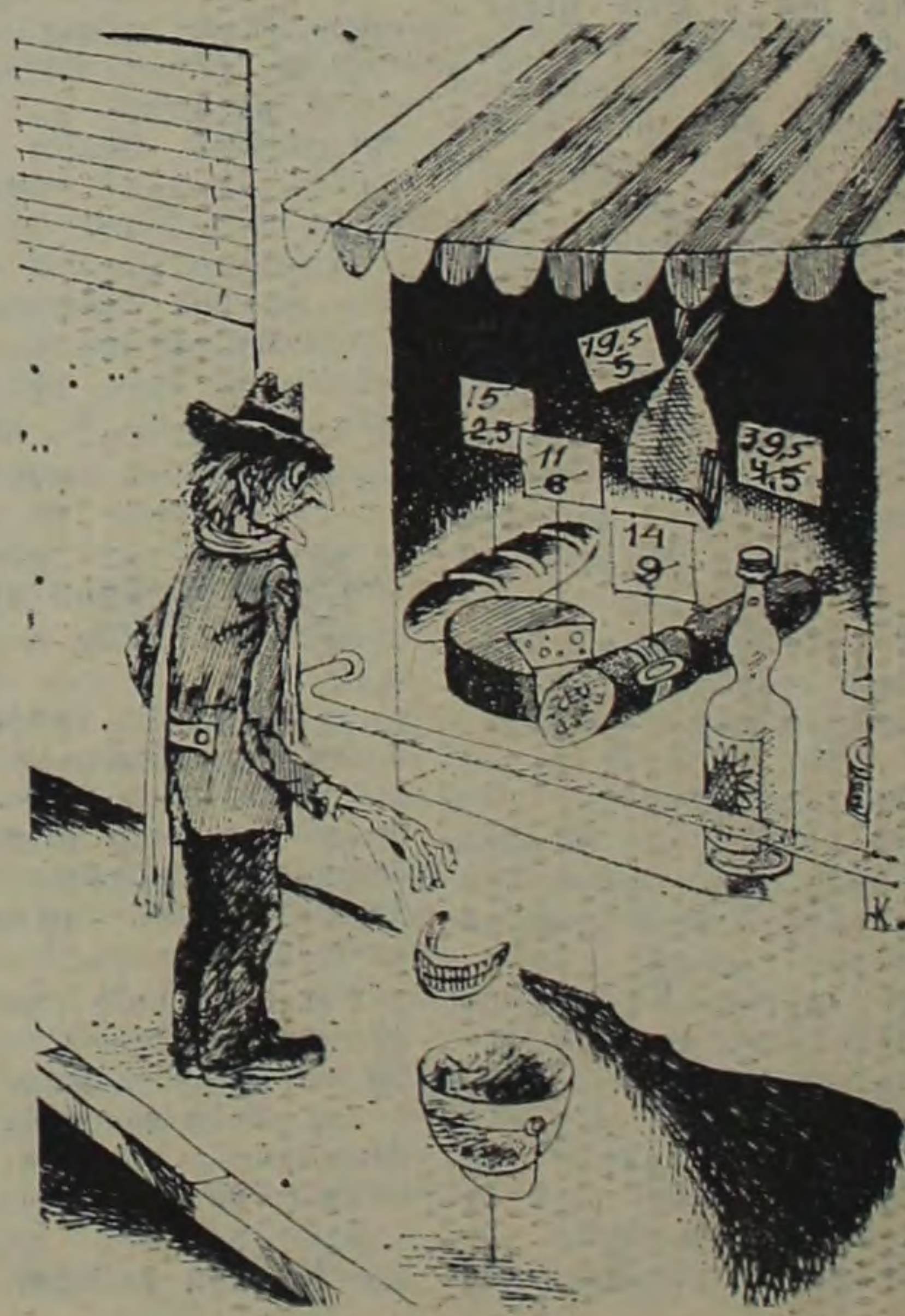
К РЫНКУ ГОТОВ...

Указанный порядок выплаты и учета компенсации вступил в силу с 1 июля 1990 года.