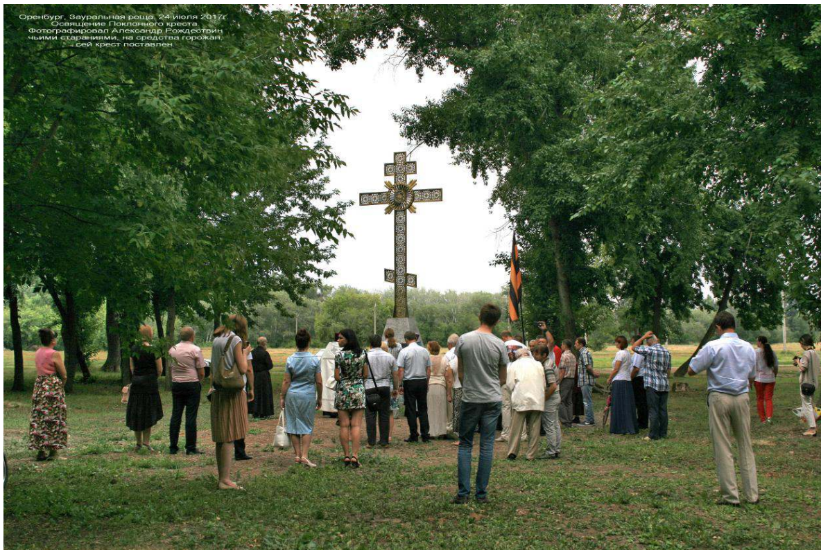
Освящение и открытие (24 июля 2017 г.) поклонного креста памяти разрушенной церкви великомученика и целителя Пантелеймона в Зауральной роще города Оренбурга.